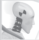
Crashtests nach ECE R44